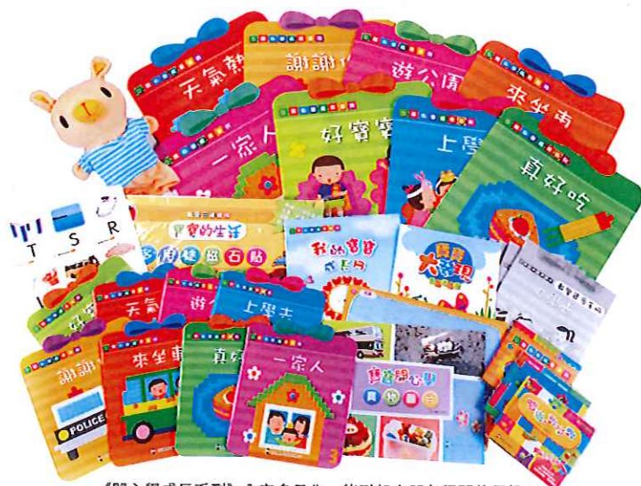
《開心學成長系列》內容多元化，能引起小朋友學習的興趣。

《開心學成長系列》是一套特別為兩歲班小朋友而設的教材，當中分有8本不同主題的學生書本，包括《上學去》、《好寶寶》、《一家人》、《真好吃》、《來乘車》、《遊公園》、《謝謝你》及《天氣熱》，每個主題更配有利用實物圖片及認知圖卡，讓小朋友能