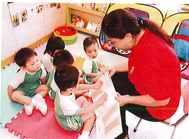
小朋友透過書本認識「手」，亦明白清潔雙手的重要。

好處：小朋友可以透過嗅不同食物的氣味，增加對不同食物的認識，除了認識它們的氣味外，更可以認識它們的顏色、外形、大小、有沒有核等。